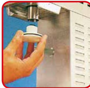
Makrolon® 材料活塞可轻松拆卸 实施完美清洁